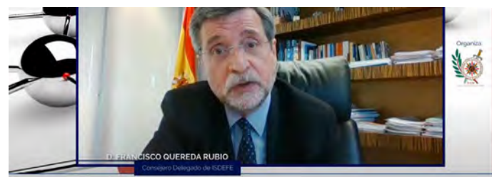
Jornadas virtuales: presente y futuro del Medio Propio