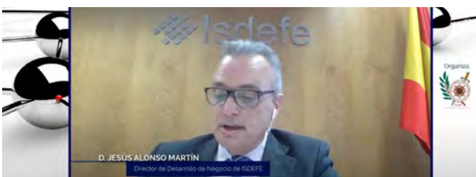
Jornadas virtuales: presente y futuro del Medio Propio