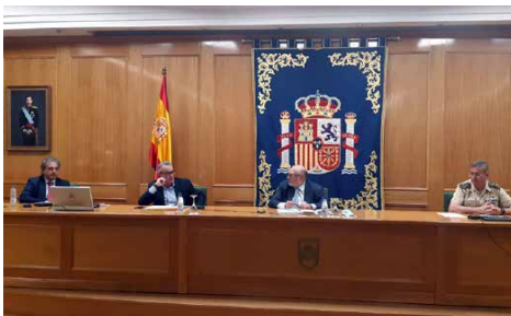
Curso anual virtual