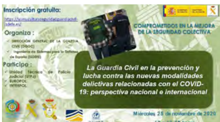
Jornada virtual de la Guardia Civil