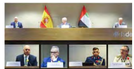
Emiratos Árabes Unidos y España