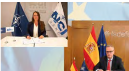
Acuerdo NFP de NCIA