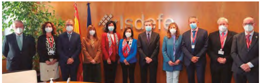
Visita de la Ministra de Defensa a Isdefe