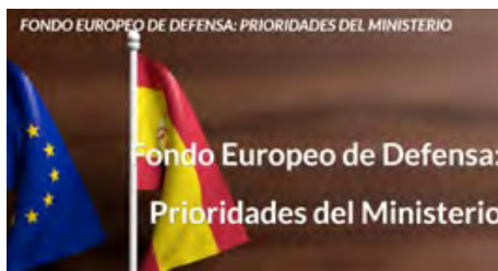
Fondo Europeo de Defensa