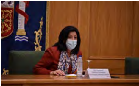
Congreso Ingeniería de Sistemas